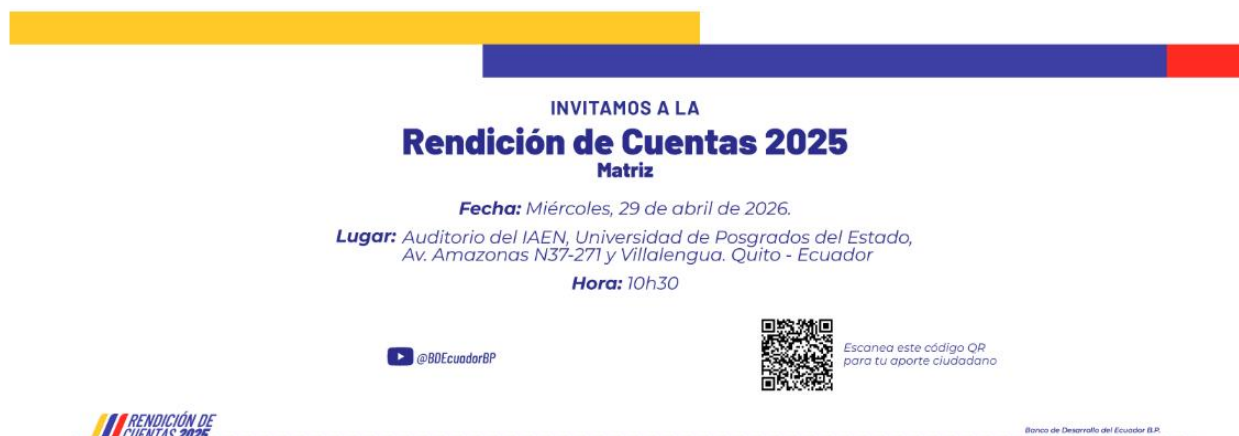
Ilustración 1. Diseño de la Invitación

Las invitaciones fueron enviadas mediante comunicados oficiales e incluyó el informe narrativo y el formulario preliminar suscritos electrónicamente por la máxima autoridad o correo electrónico, con la fecha visible, enviado a los usuarios en el término establecido.